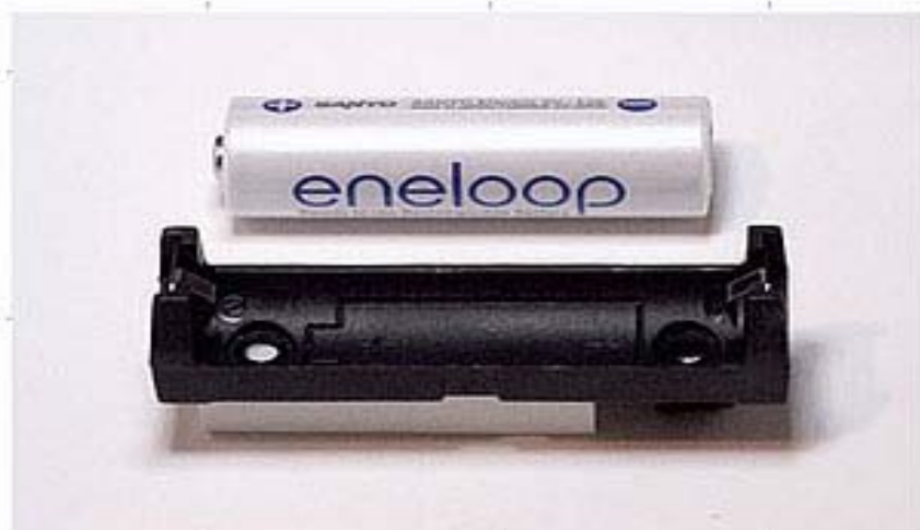
EL-1000 Lieferung ohne Akku

Entladeschluss mit dem Voltmeter überwachen !